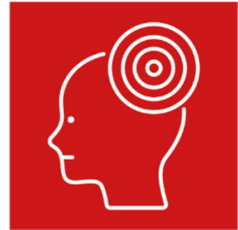
STRESS / RESILIENZ